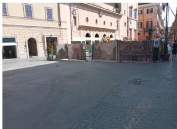
Piazza San Lorenzo in Lucina

Sono, altresì, terminati i lavori a piazza Trilussa , via del Politeama , via della Gensola e vicolo di Sant'Agata .