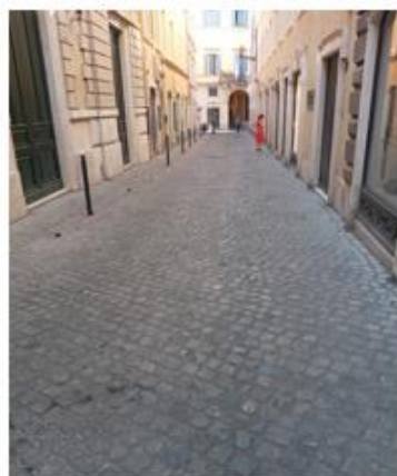
Via Campo Marzio