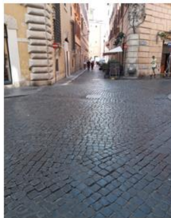
Via del Leoncino