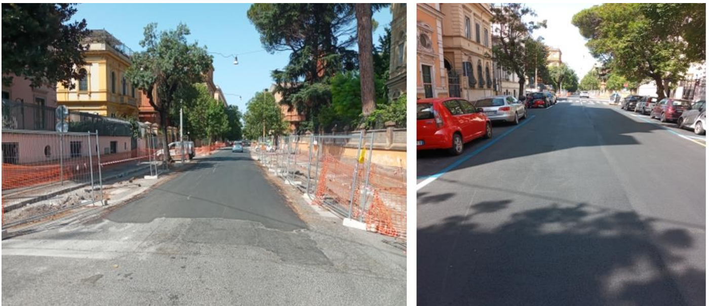
Via degli Scipioni (da via Leone IV a via Vespasiano)

Sono terminati i lavori nel primo tratto di via degli Scipioni (da via Leone IV a via Vespasiano) e sono iniziati i lavori nel tratto che parte da Lungotevere Michelangelo fino a via Alessandro Farnese come puoi vedere dalle foto che unisco.